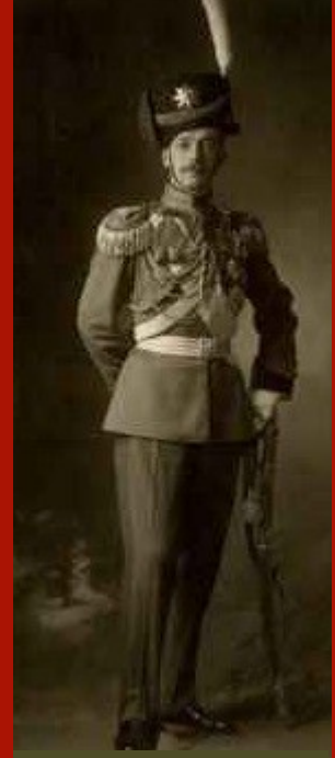
Grand dük Andrei Vladimirovich— Mathilde'nin 1921-1956 arası kocası

Matilda'nın şaşkınlığına rağmen sevgilisi Nicholas döndüğünde Panni'sinin yanına ne o gün ne de ertesi gün gelmemişti. Bunun nedeni vellihtin Berlin gezisi dışında diğer nedenlerdi. Bazıları " Kshesinskaya " yı "etkisiz hale getirmeye" çalışıyordu.