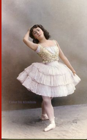
Mathilde Kschessinska'nın renklendirilmiş bir fotoğrafı