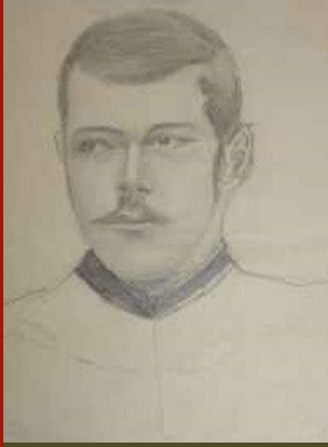
M.Kshesinskaya — kendi çizdiği II.Nikola'nın karakalem resmi

" Benimle evlenirmisin ? " Mathilde imkansız olduğunu ve asla istemediğini söyleyince Nicky : " Böyle daha mı iyi diye ? " sorar.