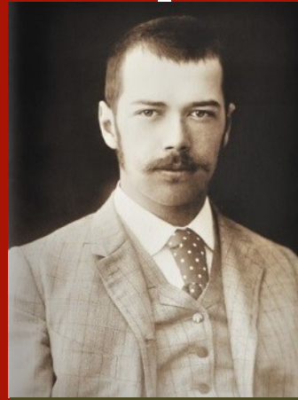
Çareviç II. Nikola

Başkente döndükten sonra Nikola kısa süre sonra tekrar uzun bir yolcukuşa çıktı. Ailesi ile Danimarka'ya gitti. Bu nedenle şirin veliaht ile ilgili M. Kshesinskaya nın tuttuğu notlar aylar sonra devam etmeye başlar.