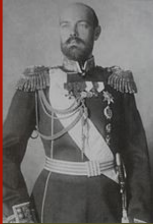
Grand dük Sergei Mikhailovich