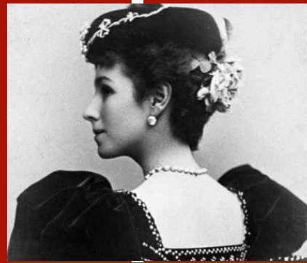
M.Kshesinskaya'nın bir fotoğrafı

zorunlu olarak bir konuşma yapacak. İki ay için elvedalaşmak çok üzücüydü. Birçok kez öpüştük. Nicky'e beni unutmaması için yalvardım.