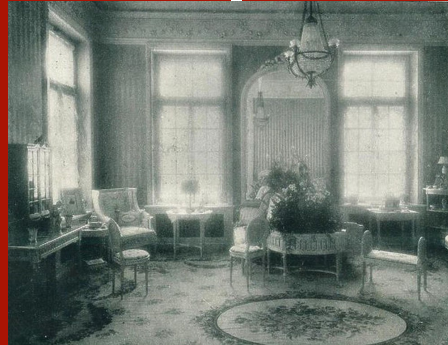
M.Kshesinskaya'nın çareviç tarafından yaptırılan villasının salonundan bir fotoğraf

Sabah velihttan bir mektup aldım. Harika. Gün içinde defalarca okudum