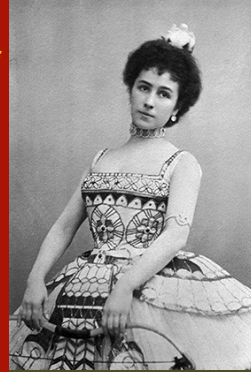
Mathilde Kshesinskaya'nın Nicholas tarafından Panni takma adını aldığı kıyafeti