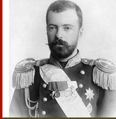
Grand dük Alexander Mikhailovich