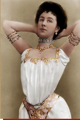
Çareviç 22 yaşında M.Kshesinskaia 17 yaşında iken çekilmiş fotoğraflarının renklendirilmiş hali.