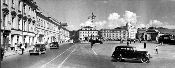
1930 ların Moskova'sı

Ancak 1930 lu yılların Sovyet rejimi yabancı misyonerleri sıkıştırdığında Amerikan evanjelistleri Rusya yı Ezekiel 38-39 kehanetindeki şeytani Magog'un ülkesi olarak tanımlıyordu. Rusya nın tek başına kötülüğün kaynağı olarak gösterilmesi So-