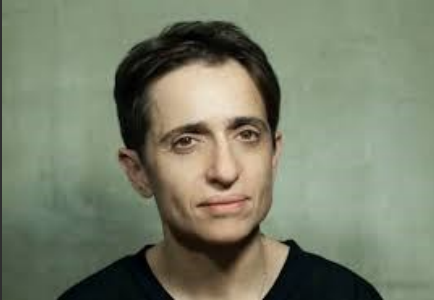
Gazeteci Masha Gessen

Rusya Amerikan çıkar ve ideallerine açıkça meydan okumaktadır. Ancak bu zorluklar insanlığın manevi kaderi için yapılan savaş hakkında bin yıllık fantezileri değil düşünceli analiz ve yeni bilgiler gerektirir.