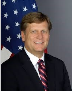
Ambassador Michael McFaul

Hiç şüphesiz şeytani imparatorluğun yıkılması kozmik zafer iddialarını ayrıca kötü siyaseti gündeme getirdi. Neoconlar Amerikan ekonomik ve siyasi düzenini insanlık tarihinin sonu olarak ilan ettiler. Zaferin beyin takımı 1990 lı yıllarda ki Rus siyaseti yüzünden otoriter bir yapının taşlarını dizmeye başladı. Ekonomik şok terapisi on milyonlarca Rus'un yoksullaşmasına canavarca yolsuzluğa bulaşmış özelleştirme ere ve NATO nun eski Sovyet bloğu ülkelerine yayılmasına yol açtı. 20 yüzyılın bilge adamı diplomat ve dışişleri siyasetçisi George F. Kennan NATO nun genişlemesini trajik bir hata olarak görüp bunun yeni bir Soğuk savaşı tetikleyeceği konusunda uyarılarda bulunmuştur.