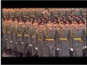
1987 Ekim Devrimi Töreni

1987 yılında Moskova da bir değişim öğrencisi olarak bir Kasım sabahı Gorki sokağına gidip Kızıl meydana ki geçit törenini izledim. Bir grup Sovyet ve ya- abancı devlet adamı genç askerlerle birlik-