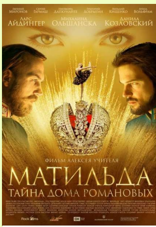
Mathilde filminin afişi

“II. Nikola'nın evlilik öncesi sevgilisi neden bu kadar olaya neden oluyor?”