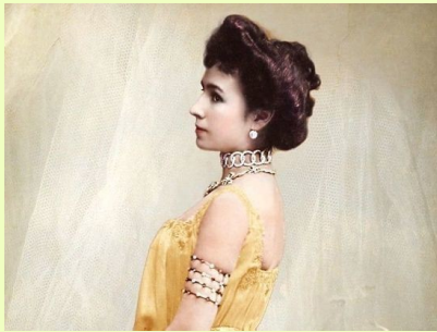
Mathilde nin bilgisayarla renklendirilmiş bir fotoğrafı

Mathilde Kshesinskaya sadece çar 2.Nikola'nın sevgilisi olmamış daha sonra 1. Nikola'nın oğlu Grand dük Michael Nikolaevich'den olan torunu Grand dük Sergei Mikhailovich Romanov ile aşk yaşamış 1921 yılında yurt dışında 2. Nikola'nın amcası Grand dük Vladimir Alexandrovich'in oğlu Grand dük Andrei Vladimirovich Romanov ile evlenmişti. Çar 2. Nikola'nın ölümünden sonra kendini ailenin başı ilan eden Krill Vladimirovich Romanov