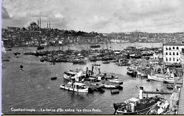
İstanbul limanı 1920 ler

gördük. Sahilde de Çanakkale boğazını geçmek için cesurca davranıp yarısı denize batmış Fransız savaş gemisinin yanından geçtik. Kaptanımız "bu boğazın dar kısımlarında ne kadar gemi battı bilemezsiniz en az 26 sı bu suların altında yatıyor" dedi.