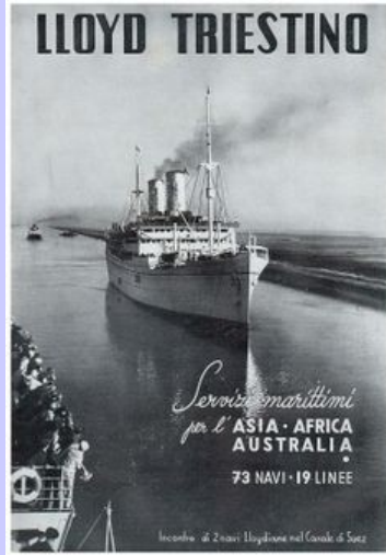
Lloyd Triestino gemi hattının 1930 lar da ki afişi

Grand düşes dahil kimsede para yoktu. Grand düşes hepimizin yolculuğuna karşılık geminin ait olduğu şirkete çok değerli bir broşunu verdi. Bildiğim kadarı ile bir çok yolcu asla Grand düşese daha sonra yolculukla ilgili parayı ödemedi. Bir süre sonra yaşlıca olan Çek orjinli