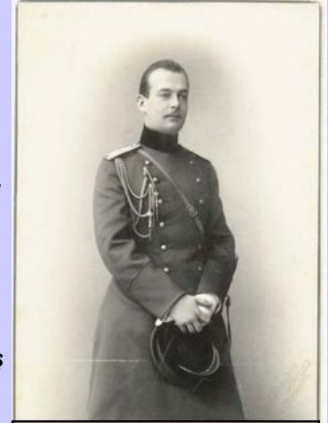
Mathilde nin kocası Grand dük Andrei Vlademirovich

Semiramisa Perşembe günü Pire ye doğru yola çıktı. Ertesi gün Gelibolu dan geçerken 5000 Fransız ve İngiliz askerinin mezarlığını