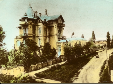
Matilda Kschessinska'nın Kislovodsk'ta ki daçası 1917

Noel den hemen önce Beyaz ordunun durumu iyi değildi. Görüldüğüne göre bu ordu Kızilları durduramıyor ve Kafkasları işgalden kurtaramıyordu. Tuzağa düşmeden Kislovodsk'u acilen terk etme kararı aldık. Novorossiks'e gidip neler olacağını görecek acil bir durum olduğunda yurt dışına gitmek için hazırda bekleyecektik. Askeriyenin başarısından emin olduğumuz için olayların