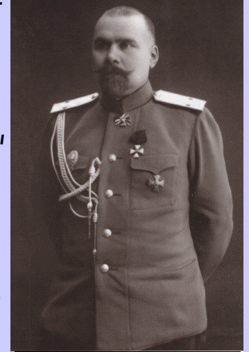
General N.M. Tikhmenev

Novorossisk de bizim gibi başka yerlere kaçma şansını denemek isteyen bir çok arkadaşımıza rastlıyorduk. Hepsi daha sonra devam edecekleri yolculukları için vize almaya İstanbul'a gidiyordu.